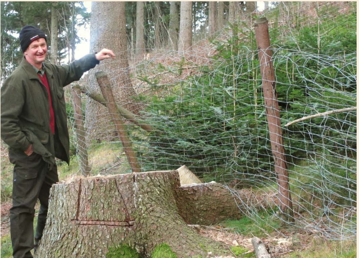
Verbissschutzzaun zur Beurteilung der Tannen-Verjüngung