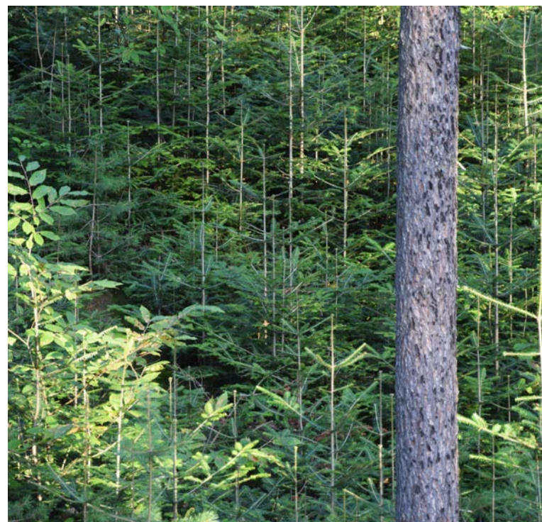
Tannenverjüngung im Wald nach Schalenwildmanagement

Was den Boden angeht ist die Zukunftsbaumart weniger anspruchsvoll: Am wohlsten fühlt sich die Tanne auf Standorten mit gut wasserversorgten Böden. Frische, tiefgründige Braunerden stehen bei ihr an erster Stelle. Aber auch karbonatreiche Substrate sowie basenarme Silikatböden werden gerne besiedelt. Mit ihrer Pfahlwurzel schafft sie es, selbst in dichte Pseudogleye mit geringer Durchlüftung einzudringen und diese gut zu durchwurzeln. Auf diese Weise erreicht sie eine große Standfestigkeit. Nur auf Kalk hat die Buche eine größere Konkurrenzkraft.