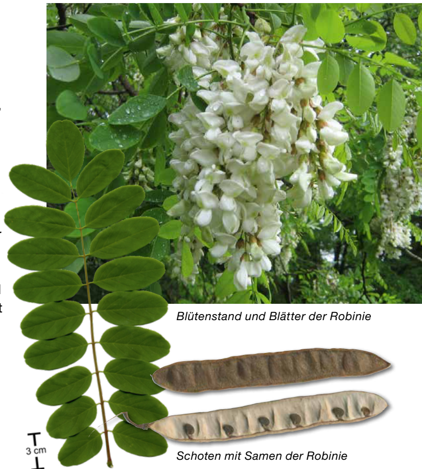
Blütenstand und Blätter der Robinie

Es kann Waldbewirtschaftern daher nur empfohlen werden, sich der Risiken und der Nachteile einer Einbringung dieser Baumart bewusst zu sein.